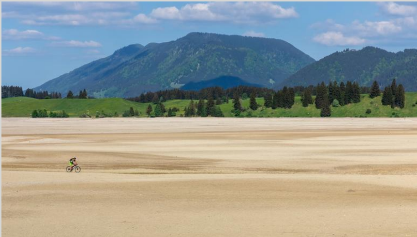
„Allgauer Wüste“ Trockengefallener Stausee