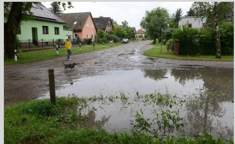
Regenereignis in Zepernick